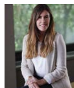
*Abogada Asociada de Roca Junyent Barcelona

Lo que sí nos atrevemos a asegurar es que las socias de las compañías, con independencia del lenguaje utilizado en el texto normativo, seguirán ejerciendo los derechos que la Ley de Sociedades de Capital les reconoce, ya se trate del derecho de separación por falta de distribución de dividendos del 348bis o de cualesquiera otros derechos previstos en la ley a favor de quienes ostenten la condición de socio/a, sean hombres o mujeres.