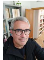
*Catedrático de Derecho administrativo de la Universidad de Valencia

empresas, los interesados en realizar estudios jurídicos, los poderes públicos, etc. Los candidatos que obtuviesen mejores calificaciones en el examen estatal podrían escoger especialidades más atractivas y, probablemente, recibirían mejores ofertas de trabajo. A la vista de ello, los interesados en estudiar Derecho, en la medida de sus posibilidades, tratarían de hacerlo en las Facultades cuyos egresados tuviesen mejores calificaciones en dicho examen. Las Administraciones públicas podrían hacer depender de esas calificaciones una parte de la financiación otorgada a los respectivos centros universitarios, con el fin de «premiar» a los mejores, etc. Este sistema podría estimular así una sana competencia entre las Facultades de Derecho españolas, competencia que en la actualidad es, lamentablemente, muy débil. Alumnos, profesores y gestores tendríamos que ponernos las pilas más intensamente de lo que ahora nos las ponemos.